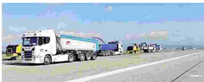
Gruppo Mascio protagonista nel rifacimento pista allo scalo di Verona